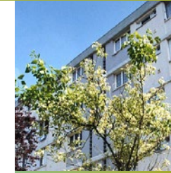
Désservis par les transports en commun