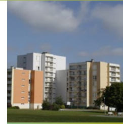
A proximité des pôles étudiants